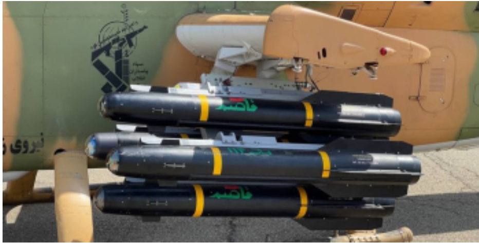
نسخه زمین‌پایه موشک ضدزره الماس با برد ۸ کیلومتر

سامانه‌های موشکی کن پرتاب، تجهیز بالگردهای تهاجمی به موشک‌های قائم ۱۱۴ و پهبادهای معراج ۱۱۳ و حنیف از جمله مهم‌ترین تجهیزاتی بوده که در این مراسم به نیروی زمینی سپاه ملحق شده است.