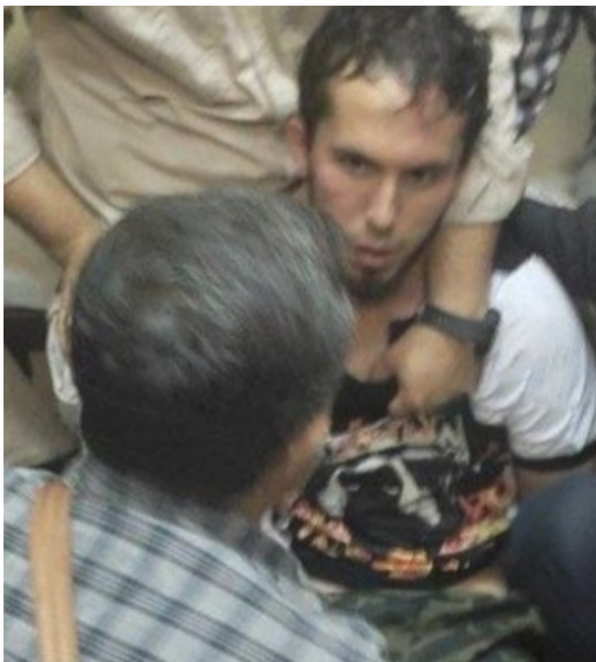
تصویر عامل عملیات تروریستی در حرم شاهچراغ